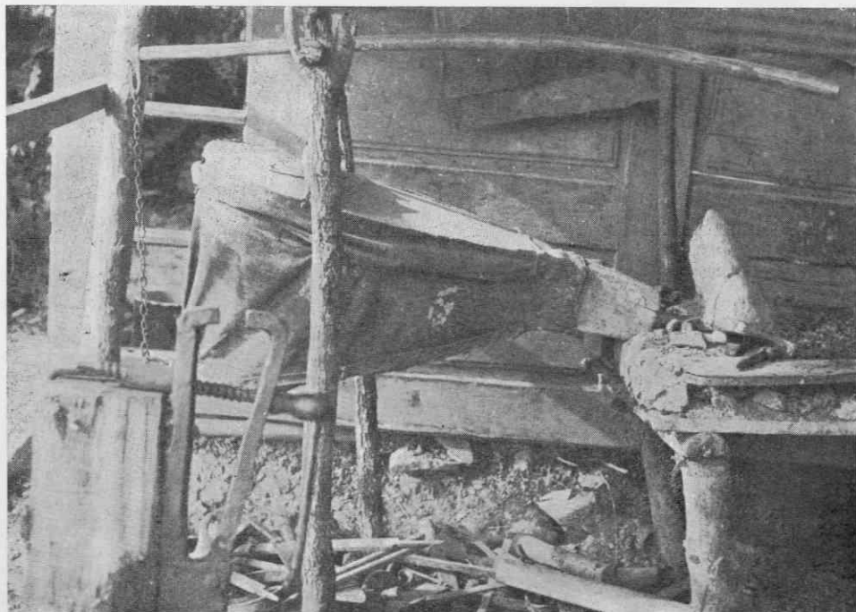
Slika 3. Kovaški meh z vignjo, Janko Hudorovac, Rosalnice pri Metliki