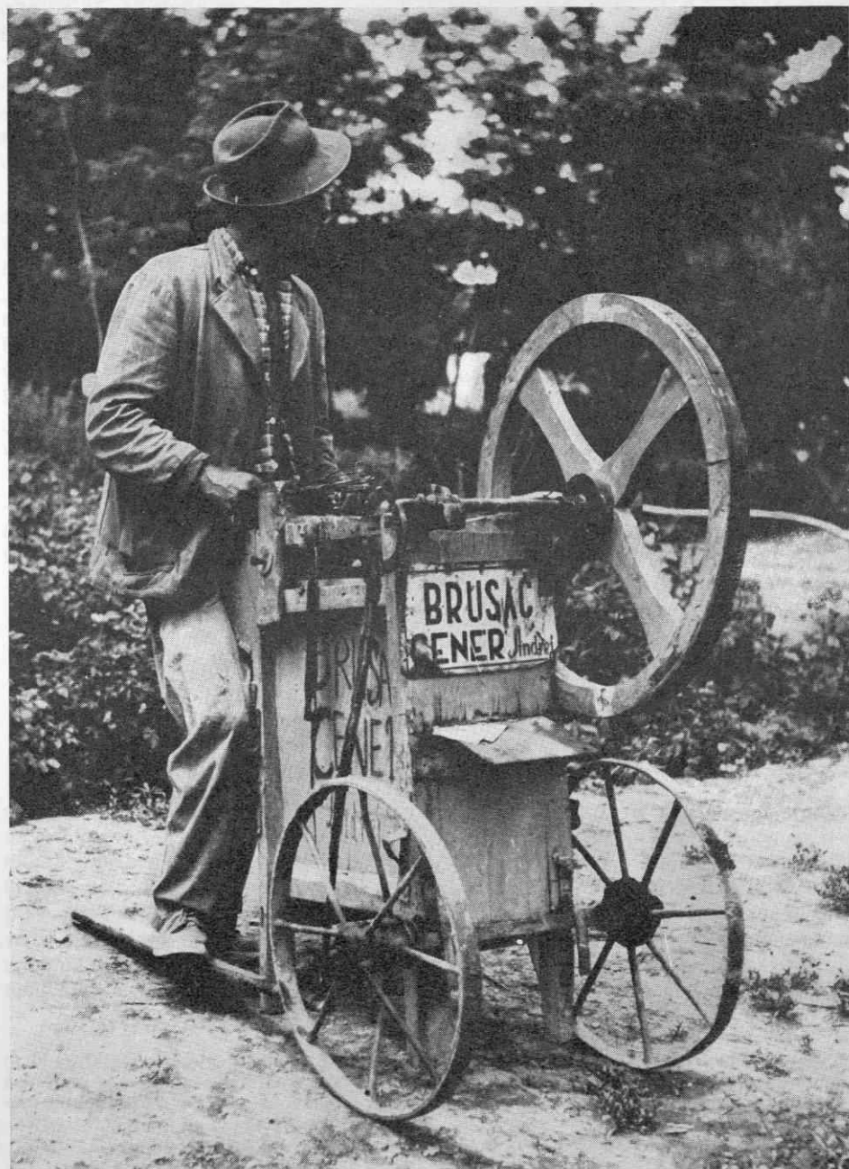
Slika 6. Bruslač Andrej Cener, Pušča — Murska Sobota