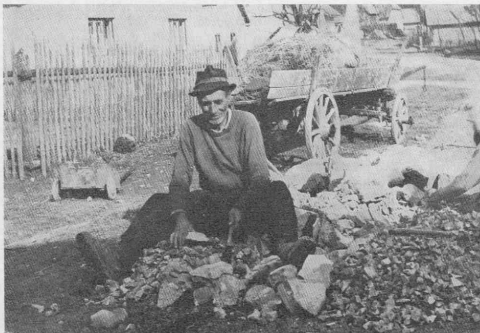
Slika 8. Cigan iz rodu Hudorovič v Kočevju drobi gramoz

V ciganski družini tolčejo kamen moški in ženske ter napol odrasli otroci. Ker so kamnolomi v raznih krajih, precej oddaljenih med seboj, je ciganska družina večkrat daleč od svojega bivališča. Zato se Cigan, ki prevzame tako delo, navadno s svojo družino začasno odseli; le najpotrebnejše imetje naloži na voz, vpreže konja in se odpelje na delo.