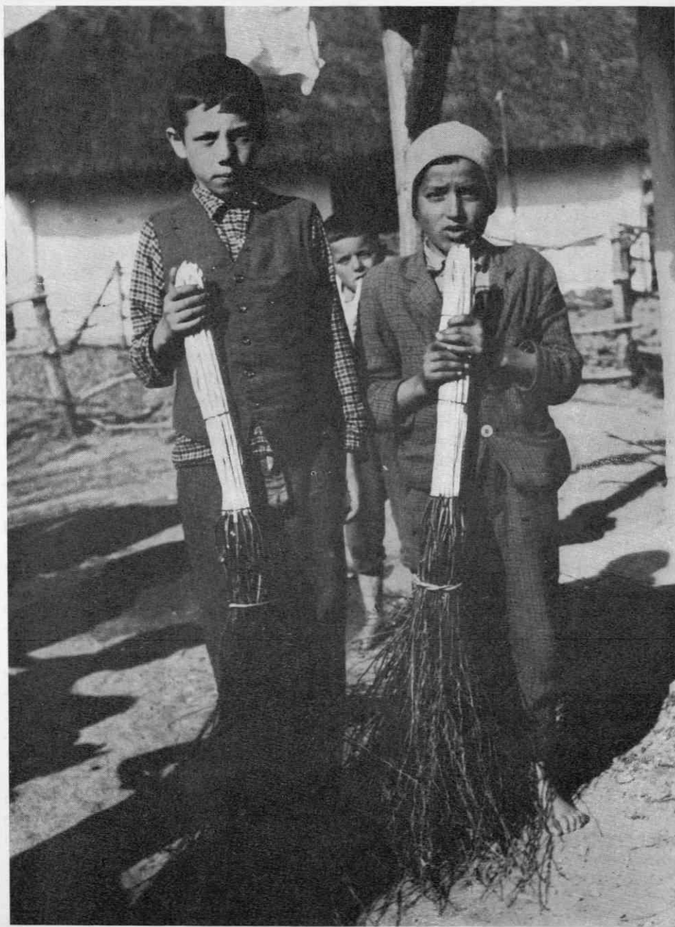
Slika 11. Cigani v Dobrovniku, Prekmurje, delajo brezove metle