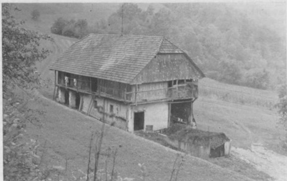
Hlev s skednjem, postavljen po požaru 1901