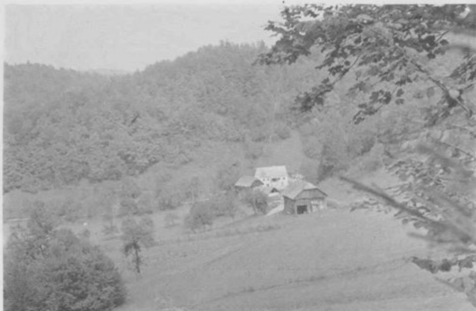
Domačija z vzhodne strani (spredaj hlev)

davčni občini Podsreda in Trebče ležeče, v prvi občini iz stavbnih parcel obstoječe nepremičnine št. 196 in 197 in iz zemljiških parcel obstoječe nepremičnine št. 1560, 1561, 1562, 1563, 1564, 1565, 1566 a in 1566 b, 1567, 1568, 1569, 1571, 1575, 1576, 1577, 1578, 1570, 1572 a, 1572 b in 1573 v skupni približni površinski izmeri 40 oralov in 204 kvadratnih klafter 10 in v čistem donosu 37 gld. 12 1/4 kr., nato v zadnji občini iz zemljiških parcel št. 435, 436 in 437 obstoječe realitete v približni površinski izmeri 1287 2/4 kv. klafter in s 7 gld. 19 kr. čistega donosa, z vsemi na njih stoječimi stanovanjskimi in gospodarskimi poslopji in kletmi in v njih se nahajajočim mrtvim inventarjem, nato eno tele, za obojestransko dogovorjeno predajno vsoto v znesku 600 gld. avstrijske veljave, reci šest sto goldinarjev a.v., v nepreklicno in neomejeno last z dovoljenjem, da postane takoj lastnik tega imetja in da se izvrši prepis gornjih realitet v zemljiški knjigi na ime prevzemnika: Martin Javeršek.