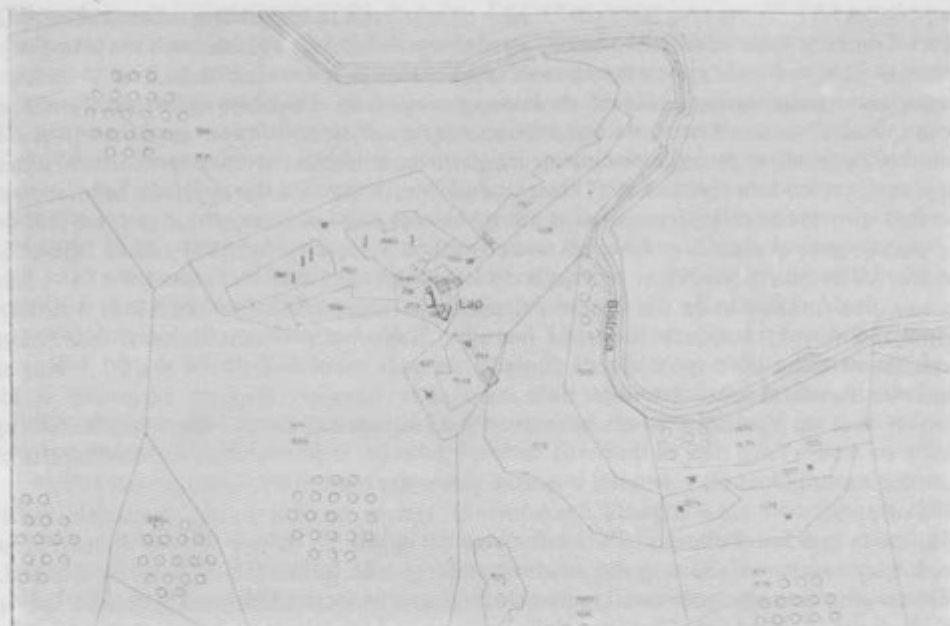
Lapova domačija v franciscejskem katastru 1826

preteklosti dokupili le koruzo in pšenično moko. Na splošno so Lapovi sposobni preživljati se na lastni zemlji.