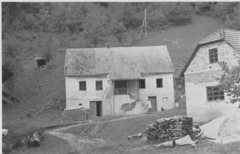
Rojstna hiša Titove matere l. 1977 (levi del je bil dozidan l. 1906)

Sedmič: Na podlagi občne vkupnosti blaga vzame ženin svojo nevesto na sosesestvo njegovih iz kupno pogodbo z dne 13. januarja 1898 za 1.700 gld a.v. kupljenih zemljišč vl. št. 36, 37, 242 kat. obč. Hörberg, 36, 37, 38 in 235 kat. obč. Trebič, in dovoljuje vknjižbo lastninske pravice na polovico vkorist njegove neveste Jozefa Kunej hitro po poroki.