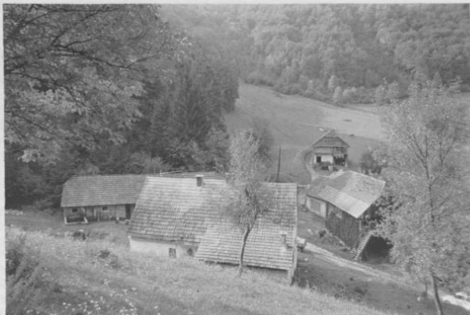
Domačija z zahodne strani