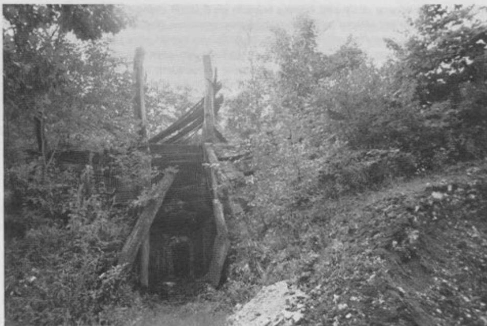
Ostanki Lapove apnenice ob Bistrici

t. VIII. zakona o sodnih taksah na din ..... 3.825.— beri: tritisočosemstodvajsetpetdinarjev.